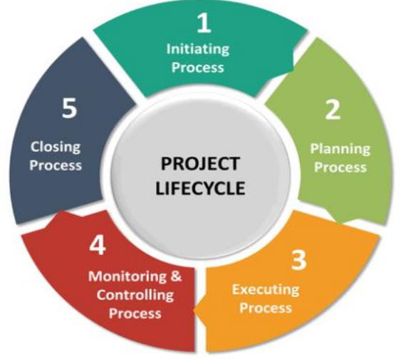
உரு1: கருத்திட்டச் சக்கரம்

இவ்வாறானத்தில் கலந்துரையாடப்பட்ட பெறுபேற்றினை அடிப்படையாகக் கொண்ட திட்டமிடல் செயற்பாடுகள் சர்வதேசத்தின் மிகச் சிறந்த நடைமுறைகளுடன் இணைந்து போகின்றவை ஆகும்.